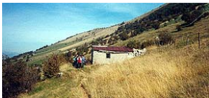
Veduta della baita dall'esterno in località Prai

Fin dall'epoca romana e medievale il monte baldo è stato interessato da una consistente pastorizia ovina e caprina con forme di trasumanza lungo percorsi tradizionali.